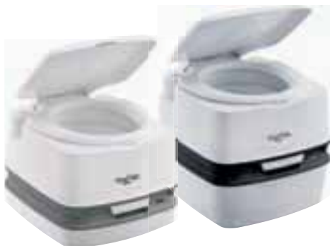
Prenosni WC Porta Potti Qube 145 46.80 EUR