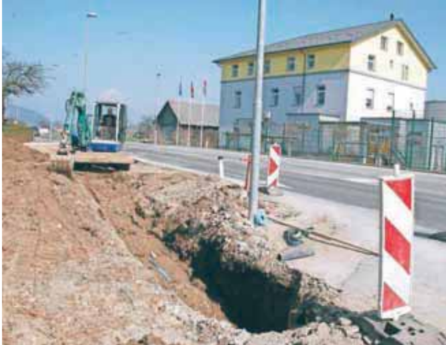
Po območju krajevne skupnosti Žabnica poteka gradnja kanalizacije v projektu Gorki.

V KS Žabnica delujejo Prostovoljno gasilsko društvo, Športno društvo, Društvo upokojencev Žabnica in Združenje borcev za vrednote NOB.