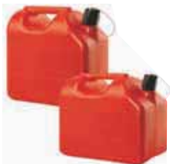
Kantica za gorivo, 10 l, 7.53 EUR Kantica za gorivo, 20 l, 12.05 EUR