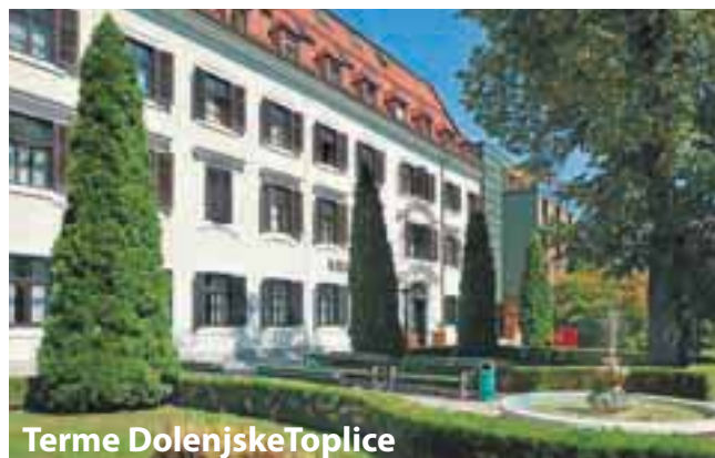
Terme Dolenjske Toplice