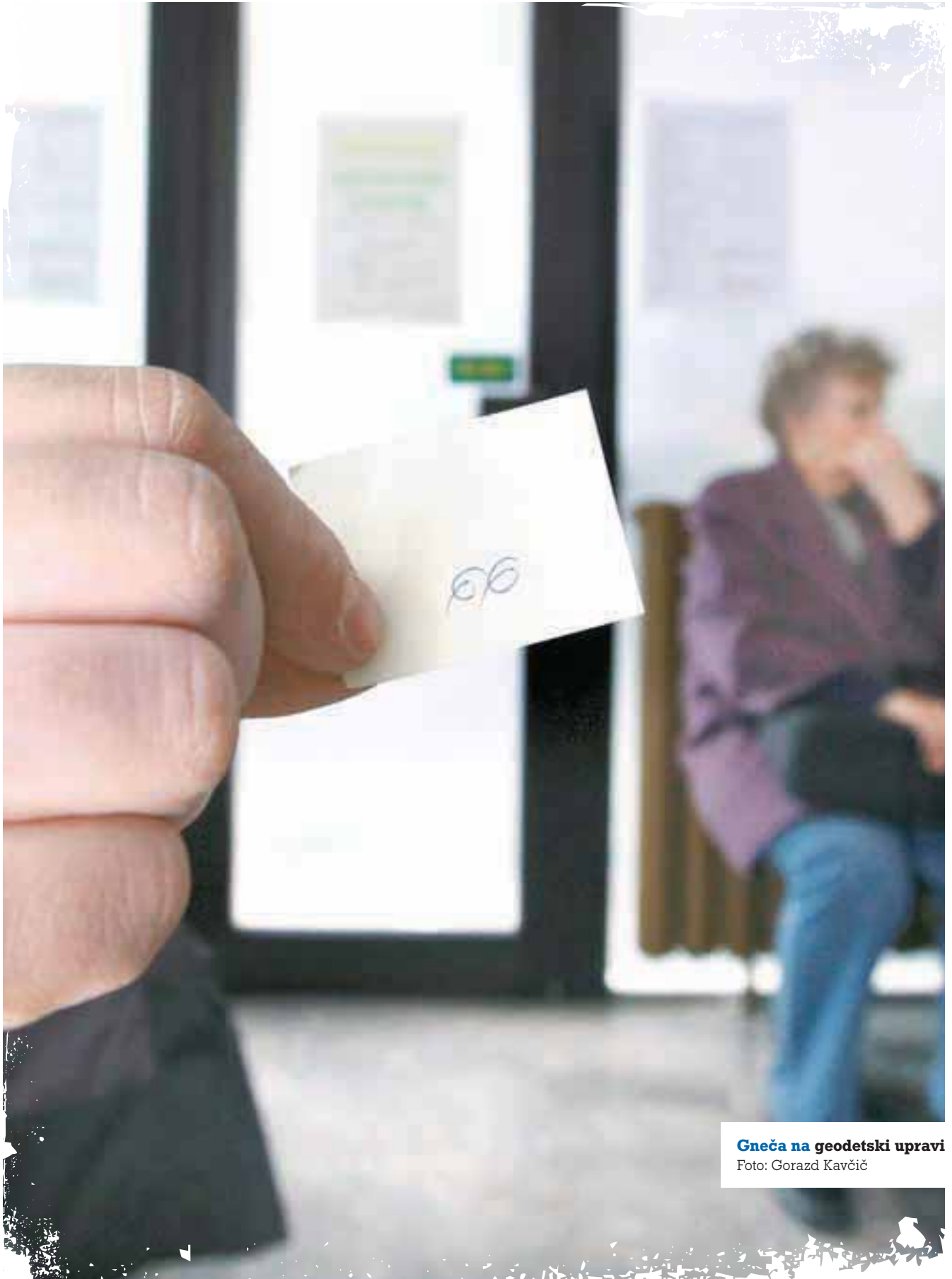
Gneča na geodetski upravi