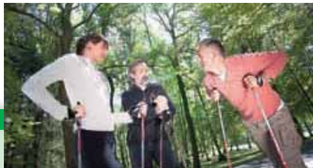
Terme Šmarješke toplice