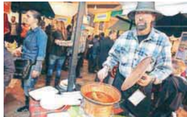
Slavonski pekoči čobanac