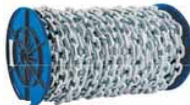
Veriga, nerjaveča, fi 6, 7.80 EUR/m (DIN766) Veriga, nerjaveča, fi 8, 14.60 EUR/m (DIN766)

Vse cene so v EUR in vključujejo DDV. Cene veljajo do razprodaje zalog. Slike so simbolne.