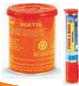
Dimni signali, ročne bakle, signalne rakete