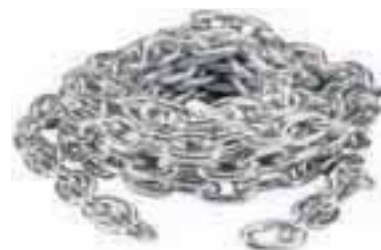
Veriga, vroči cink, fi 6, 2.46 EUR/m (DIN 766 kalibrirana) Veriga, vroči cink, fi 8, 4.15 EUR/m (DIN 766 kalibrirana)