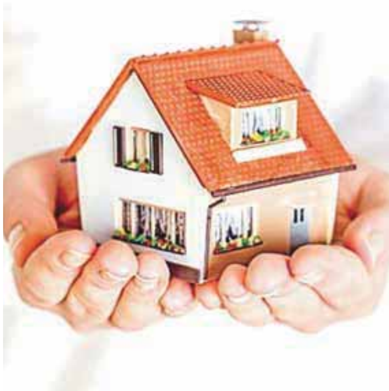
Prepušitate se strokovnjakom.

Razvojna agencija Sora je ena od vstopnih točk VEM (Vse na Enem Mestu), kjer svojim strankam nudijo brezplačne postopke registracije, doregistracije in preregistracije dejavnosti za samostojne podjetnike (s. p.) in družbe z omejeno odgovornostjo (d. o. o.), splošno podjetniško svetovanje ter pomoč pri pripravi poslovnih in investicijskih načrtov ter prijavi projektov na razpise, brezplačno svetovanje o učinkoviti rabi energije, ugodne kredite preko kreditne sheme Razvojne agencije Sora, informiranje o aktualnih podjetniških vsebinah (e-bilteni, spletne strani, e-forum), podjetniška izobraževanja za osnovnošolce, mlade, ženske, potencialne podjetnike ter delujoča podjetja. Razvojna agencija Sora poleg tega nudi tudi administrativno in finančno pomoč Lokalni akcijski skupini loškega pogorja.