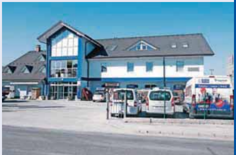
... in najbolj znan v Žabnici.