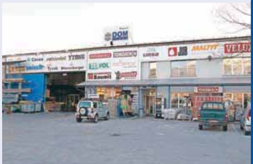
... v Lescah ...