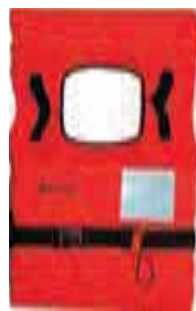
Rešilni jopič 100N 9.99 EUR