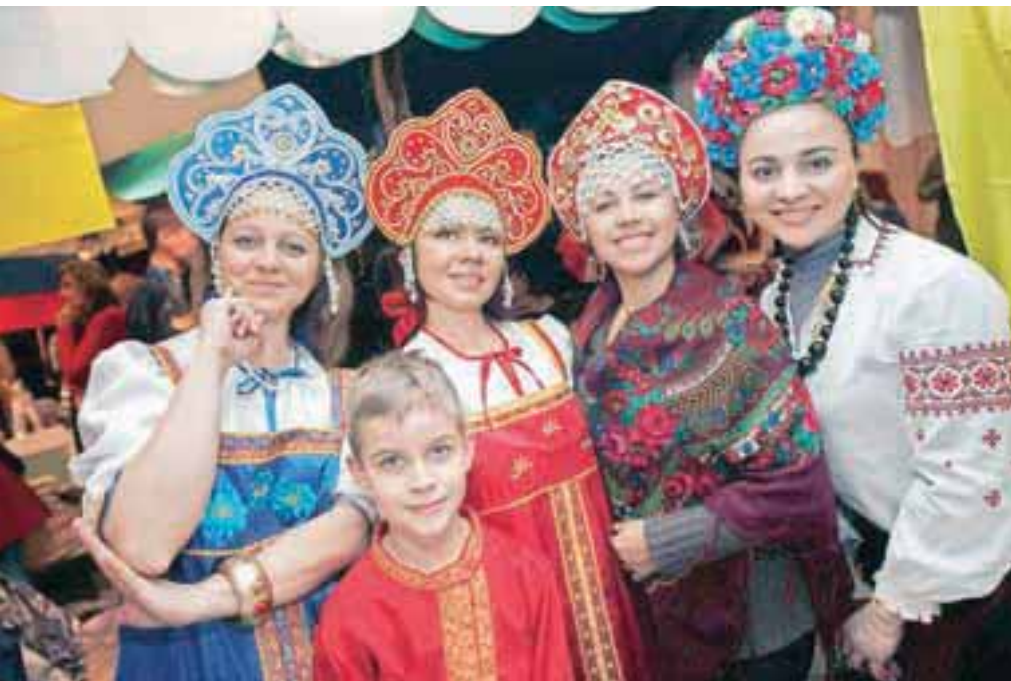
Prikupni predstavniki Rusije in Ukrajine na festivalu kulinarike

Priprava: Očistimo čebulo in zarezemo vsako glavo tako, da dobimo pokrov (spodaj in zgoraj). V lonec iztisnemo sok limone in žličko kisa. Ko zavre, položimo čebulo za nekaj minut v krop. Čebulo pazljivo odstranimo iz kropla in počasi iz sredine razslojujemo kolute. Mleto meso pomešamo z rižem ter dodamo začimbe. Nežno napolnimo sloje čebule z maso in polagamo v nizko posodo za kuhanje. Zalijemo z vodo in maslom. Kuhamo na zmernem ognju približno 30x30 min t. Ko je jed skuhana, jo serviramo v servirni posodi skupaj s kajmakom.