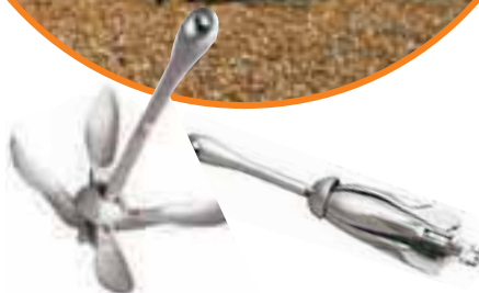
Sidro maček, 1.5 kg, 6.12 EUR Sidro maček, 4.0 kg, 15.33 EUR Sidro maček, 6.0 kg, 22.80 EUR