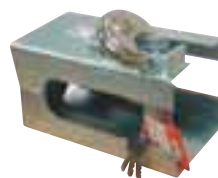
Varnostna ključavnica za prikolico 16.95 EUR