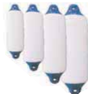
Bokobran, 120 x 450 mm, 5.80 EUR Bokobran, 150 x 580 mm, 8.41 EUR Bokobran, 210 x 620 mm, 12.46 EUR Bokobran, 240 x 700 mm, 17.30 EUR