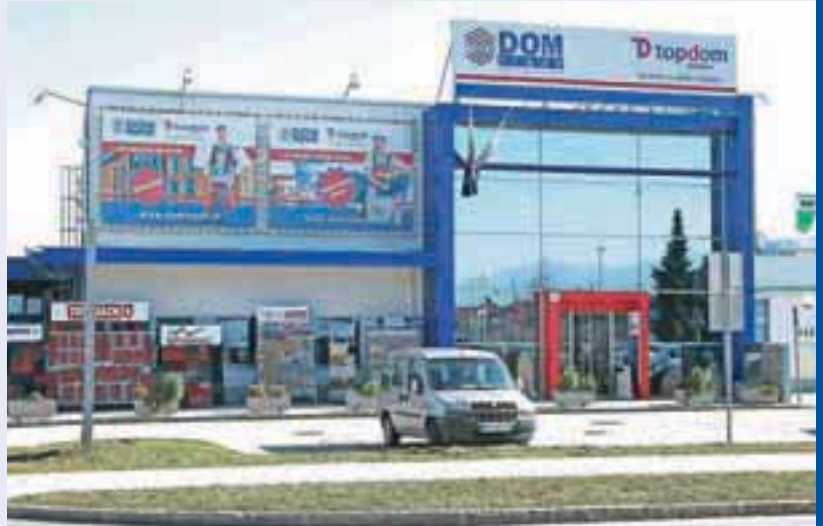
Poslovni center v Kranju ...

Petindvajseti rojstni dan bodo proslavili delovno. V mesecu aprilu bodo v svojih treh centrih stranke pogostili z dnevi odprtih vrat. Ves april bo namenjen tematskim dnevom, ki bodo razdeljenimi po posameznih blagovnih skupinah, tako da bodo stranke lahko seznanjene z vsem, kar DOM Trade Žabnica ponuja.