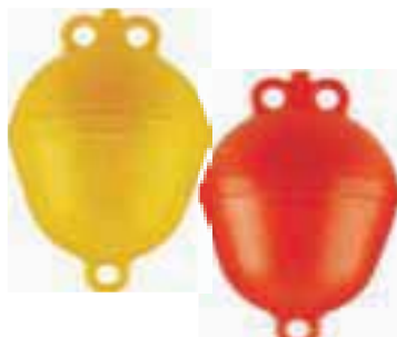
Boja rumena/oranžna 250 x 390 mm, 4.95 EUR