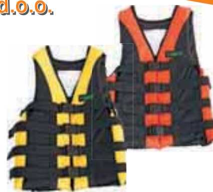
Jopič za vodne športe 50N, 16.50 EUR